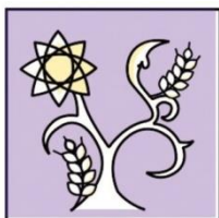
Scuola Italiana di Cognitivismo Clinico